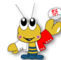
荒尾市マスコットキャラクター「マジャッキー」