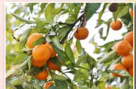
▲完熟したミカン。たくさんの人から「おいしい」と言ってもらえてうれしかったです

ミカンが最盛期を迎え、年末まで毎日収穫作業をしていました。今季は全国的に豊作で、荒尾では夏の干ばつの影響でミカンの木に水分ストレスがかかり、糖度が高くおいしいミカンになったようです。ミカンは栄養が豊富で、3個食べると一日に必要なビタミンCをまかなえます。私も毎日ミカンを食べ、風邪しらずで元気です。ミカン農家の先輩たちもとてもパワフルで元気な人が多いような気がします。春からの就農にむけて、おいしいミカンを作りたいという情熱をもって準備していきます。協力隊の任期も残りわずか。引き続き、頑張っていこうと思います。