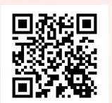
荒尾市地域おこし協力隊 Facebook