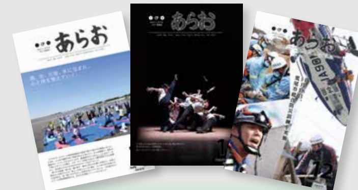
▲毎年力作ぞろいの「あらお」が届きます。それぞれに個性があり、どんな子が書いたのかなと想像するのも楽しいです。(広報担当者)