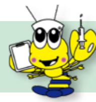
荒尾市マスコットキャラクター「マジック」