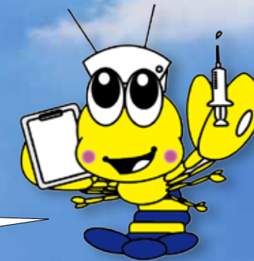
荒尾市マスコットキャラクター「マジャッキー」

高齢者の増加・価値観の多様化に伴い、病気や障がいがある人でもできる限り住み慣れた場所で自分らしく過ごすため、「生活の質」を重視する医療や介護が求められています。地域医療機関やさまざまな保健・福祉サービス機関との連携窓口として、「荒尾市在宅医療連携室 在宅ネットあらかお」は切れ目のない医療・看護・介護サービスを皆さんに提供できるよう努めていきます。