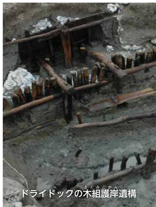
ドライドックの木組護岸遺構

1853年、アメリカ軍ペリー提督が浦賀(神奈川県)に来航しました。それ以降、幕府は江戸時代初期から続いていた大型船建造の禁止を解き、強まる西洋諸国の脅威から国を守るため、諸藩に命じ、自ら洋式軍艦の建造に取り組みます。その中で、いち早く西洋の技術を取り入れて、独自に洋式海軍の創設と洋式艦船の整備・運用を実現したのが佐賀藩でした。