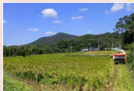
▲秋の陽気に包まれての稲刈りは気持ち良いですね

農繁期がスタートしました。稲刈りにオリーブの収穫、味噌作りなど充実した毎日です。大事に育てた稲を収穫できる喜びを噛みしめながら、先生用と実習用の田んぼ合わせて一町七反の稲刈りを行いました。先生のマンツーマン指導のおかげで、稲も倒れず、病害虫の被害も最小限に抑えることができました。先生に感謝するとともに、いつか先生のように後輩を指導できる農家になりたいと思いました。ことしの荒尾産オリーブの収量は少ないようですが、実は立派でした。我が家では荒尾産オリーブオイルを味噌汁に少し入れて食べています。体にも良くおすすめです。