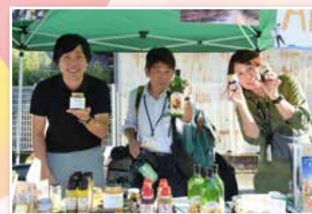
▲左が僕です。3年間の全ての出会いに感謝し、次のステージでも頑張ります