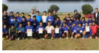
玉名荒尾中体連陸上大会

9月13日に行われた玉名荒尾中体連陸上大会では、学校対抗の部で16校中の2位、9月29日の県中体連陸上大会では女子学校対抗で5位に入賞しました。10月16日の玉名荒尾中体連駅伝大会では男子が2位となり、玉名荒尾中体連になって初の県大会出場となりました。その他、野球部とサッカー部が玉名荒尾大会で優勝するなど各部で上位入賞が続いています。