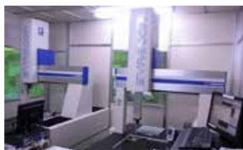
▲オペレーターの作業負担を軽減することで「ものづくり」に集中できる環境づくりに成功

当社は、各工場に三次元測定器を14台配置し、全ての作業工程をモニタリング。工程ごとに検査合格済みという確認サインがなければ次工程には持ち込めないシステムが確立されています。これにより、最終工程への不良品持ち込みの限りないゼロを可能にしています。