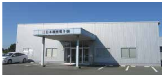
超切削精密加工部品(三次元5軸加工など)が得意