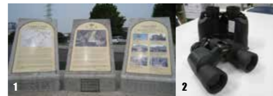
1. 万田坑に設置した総合案内板。2. 荒尾干潟の生態を観察できる双眼鏡。3. 国道 389 号に設置した PR 看板。 ◆1～3 のような事業に寄附金を活用しています。

申込書は電話で政策企画課へ請求するか、市ホームページからお取り寄せください。 ※市ホームページから直接申し込みもできます。