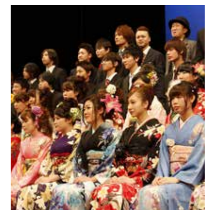
▲平成 26 年の成人式の記念撮影。多くの新成人のみなさんにご参加いただきました。