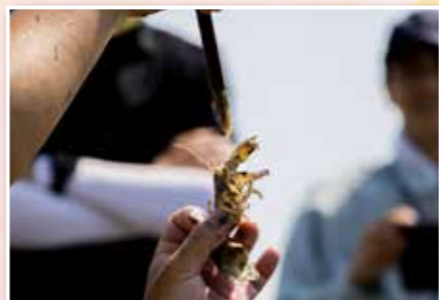
▲荒尾の夏といえば、マジック釣りですね！

暑い夏の日差しと蒸し風呂のような干潟で、筆を使いマジックを釣るとするのはなかなか大変なことですが、つつい夢中になってしまいます。来年もチャンスがあれば、次こそは自分の記録を更新したいと思います。