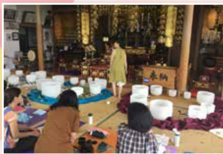
▲妙国寺で行われた「クリスタルボウル三重奏演奏会」。演奏後の副住職のお経も素敵でした

移住検討者への情報提供のため、空家バンクの登録物件を見学しました。「接続している道路は広いか」、「家庭菜園ができるような敷地か」など、チラシ一枚では伝わりにくい周辺環境や敷地情報を伝えていきたいです。豊かな緑に囲まれて、買い物にも困らない「便利な田舎暮らし」は、コンパクトな荒尾だからこそできる魅力。そんな荒尾の魅力も伝えていきたいです。