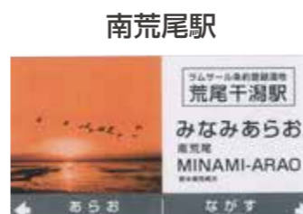
注：写真はイメージです。

荒尾駅に付けました。各施設に「近くて便利な駅」というイメージを県内外に広く発信するとともに、公共交通機関を利用して各施設へアクセスできることをPRし、駅周辺の活性化と鉄道利用者の増加を図ることを目的としています。併せて、駅ホームの観光案内版、駅構内からバス停への誘導案内板などのリニューアルを行い、来訪者の利便性の向上を図ります。リニューアルの実施は9月を予定しています。【愛称名】 ●荒尾駅 「世界文化遺産 万田坑駅」 ●南荒尾駅 「ラムサール条約湿地 荒尾干潟駅」 ☎産業振興課観光推進室 63・1421