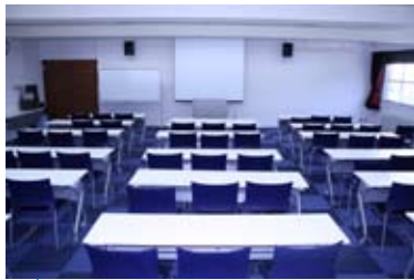
地域医療研修センター

なお、現行の熊本大学医学部附属病院の協力型病院の指定については継続し、当面は基幹型との併存となります。