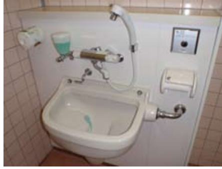
オストメイト対応の設備

すでに整備済みの市庁舎内11号会議室横身障者用トイレと文化センター身障者用トイレと併せて、ご利用ください。