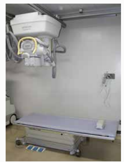
▲今回導入した最新のX線撮影装置

今回のX線撮影装置の導入により、既存の救急外来専用CTと合わせ、更に地域の救急医療に貢献できる画像診断機器の設備が整いました。これからも、より充実した高度な救急医療を提供できるように尽力していきます。