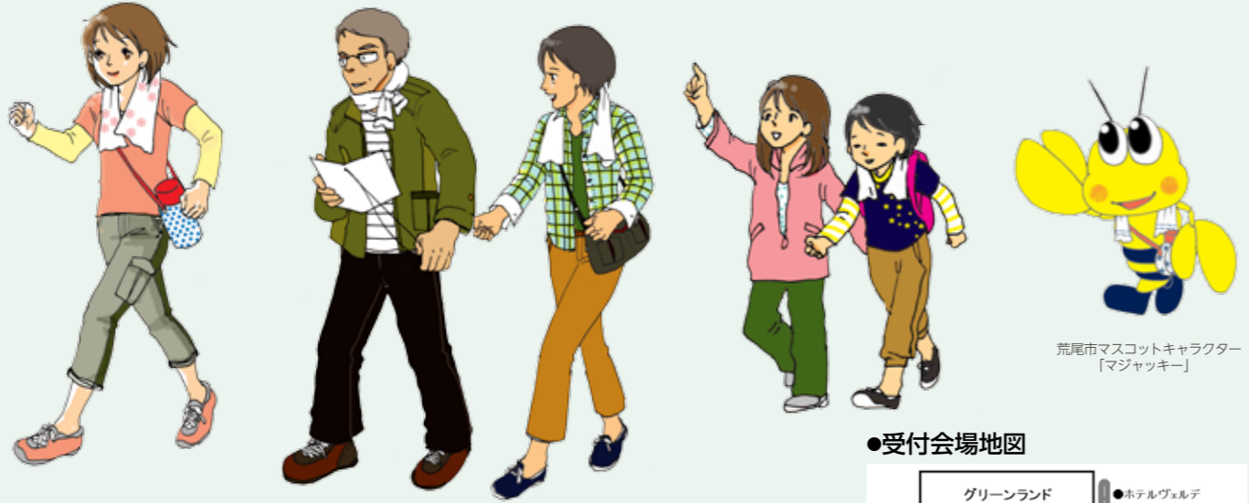
荒尾市マスコットキャラクター「マジャッキー」

梨 3kgが 30人に当たる！ お楽しみ抽選会 だご汁配布・特産品販売もあります。