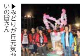
みどりが丘元氣かいの皆さん