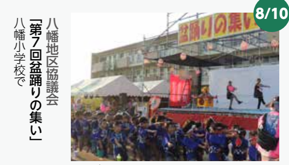
八幡地区協議会 「第7回盆踊りの集い」 八幡小学校で

各地区で、夏祭りや盆踊りが開催されました。さまざまな催しやバザーでにぎわい、どの会場も歓声で満ちていました。