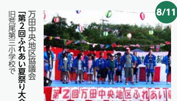
万田中央地区協議会 「第2回ふれあい夏祭り大会」 旧荒尾第三小学校で