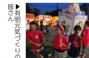
皆さん 有明元気づくりの

「有明元気づくり」と「みどりが丘元氣かい」の皆さんが、荒炎祭の行灯パレードに参加し、手作りの行灯を披露しました。今年、有明元気づくりの皆さんがパワフル賞を受賞しました。