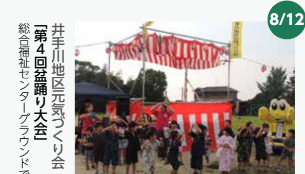
井手川地区元気づくり会 「第4回盆踊り大会」 総合福祉センターグラウンドで