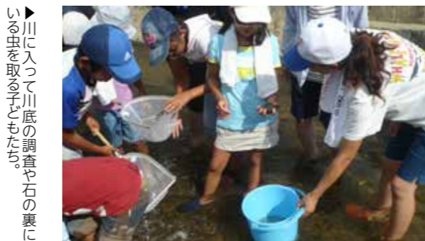
川に入って川底の調査や石の裏に いる虫を取る子どもたち

岩本橋近くの関川で開催された生物教室に、荒尾市、南関町、大牟田市の児童26人が参加しました。参加者は、川の色や臭いを確認し、試薬を使って水質を調査したり、川底にいるコガタシマトビケラなどの水生生物を捕まえ、分類し、川の水の環境評価を行ったりしました。今年の結果は5段階中3番目の「不快を感じない水環境」で、昨年より1段階下がりました。