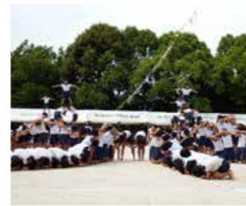
▲5・6年生の組体操。176人の団結が輝きました

前 日の雨が嘘のような爽やかな晴天の下、ことしの運動会は予定通り5月27日に実施できました。前日から5・6年生、多くのPTA役員やPTA体育委員の協力で準備を進め、当日はたくさんの方が観覧に訪れました。