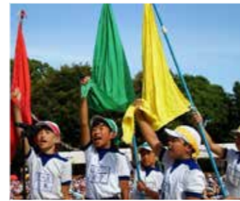
▲3団の各応援団長が誓いの言葉を力強く述べました