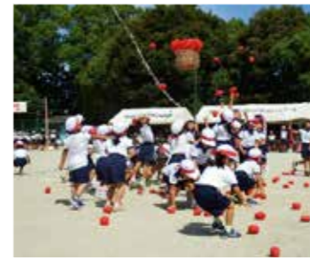
▲1年生の玉入れ。チームで協力して頑張りました