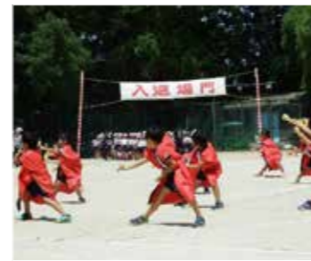
▲4年生の、「よさこいソーラン」。力強い踊りでした