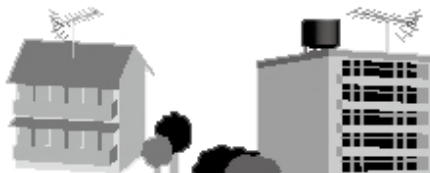
共同受信施設のアパート・マンション

地上デジタル放送を受信するための費用は自己負担で実施することが基本ですが、共同住宅（アパート・マンション）内の共同受信施設や、建造物などによる受信障害対策として設置された共同受信施設では、地上デジタル放送対応のための経費負担が過重となる場合があるため、その一部を国が助成する制度があります。ただし、国・地方公共団体などが所有する共同受信施設は助成対象とはなりません。助成対象となるのは世帯当たり 3 万 5 千円以上の負担経費がかかる場合で、最大 2 分の 1 の助成が受けられます。