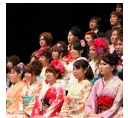
▲平成25年の成人式の記念撮影。多くの新成人のみなさんにご参加いただきました。

直接会場にお越しください。成人式の案内通知はありません。 ※市外に住居票がある人で、荒尾市の成人式に参加を希望する場合は、①氏名 ②生年月日 ③電話番号などの連絡先を問い合わせ先にご連絡ください。当日の受付名簿を作成します(当日参加も受け付けます)。市内に住居票がある人は、連絡の必要はありません。 ● 内容 アトラクション、式典、記念行事、記念写真撮影 ※市ホームページにも成人式について掲載しています。