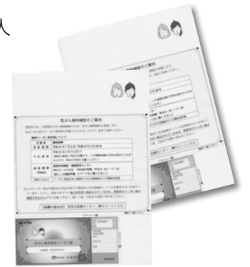
▲このようなクーポン券を対象者に送ります。

子宮頸がんは20～30歳代に増加傾向にあり、乳がんは50歳前後でピークを迎えます。日頃から健康的な生活習慣で病気を予防し、早期発見のため検診を受けましょう!