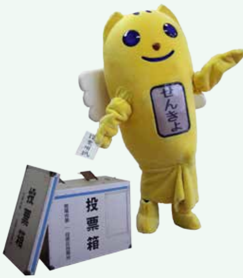
▲明るい選挙のイメージキャラクター「選挙のめいすいくん」

【選挙速報】 市ホームページに選挙当日の投・開票状況などを掲載します。 選挙管理委員会 ☎63・1254