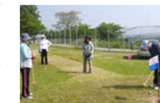
主催 井手川地区協議会

井手川地区ではグラウンドゴルフ大会が盛んに行われています。今年度初めての大会ということもあり、盛り上がりを見せました。皆さんが楽しめるように、季節によって様々なコースを工夫して作っています。