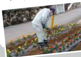
主催 一小校区元気づくり委員会

一小校区元気づくり委員会の取り組みで、市民病院前にある「シンボル花壇」を黄色やオレンジなど、美しい花々で彩りました。