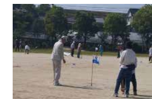
主催 八幡地区協議会

八幡小学校で行われたグラウンドゴルフ大会では、親子での参加も多くみられました。昨年は雨天のため中止になりましたが、今年は晴天に恵まれ、たくさんの方の参加者の歓声でにぎわいました。