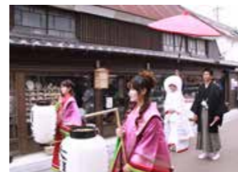
▲肥後街道での花嫁道中