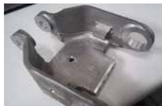
▲振動試験装置の部品となるマグネシウム加工製品