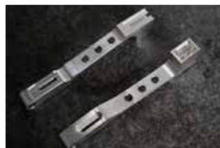
▲オリンピック選手に特注で製作したスピードスケート用部品