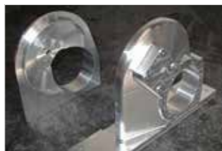
▲CAD データを元にした 3D 加工製品