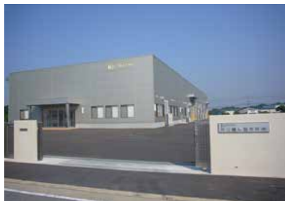
▲共立機械製作所株式会社 荒尾工場

市内でいきいきと頑張る企業をご紹介！地元就職を考えている学生の皆さんも必見ですよ