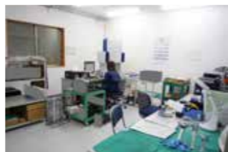
▲温度管理された室内で製品を検査します

市内でいきいきと頑張る企業をご紹介！地元就職を考えている学生の皆さんも必見ですよ