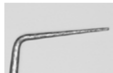
▲先進的な先端曲げ加工技術を要するプローブピン先端