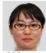
みちみずとんか 道鬼つかさ

診療においても日常においても、「相手の気持ちに寄り添う」ことを一番にしています。まずは相談してもらえればと思います。