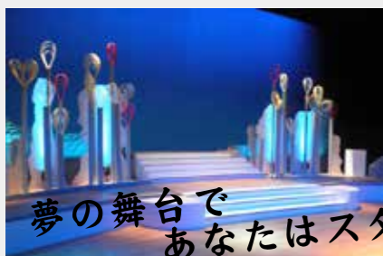
夢の舞台上 あなたはスター!

※詳しくは「荒文カラオケフェスタ」のチラシをご覧ください。申込書はチラシの裏面にあります。