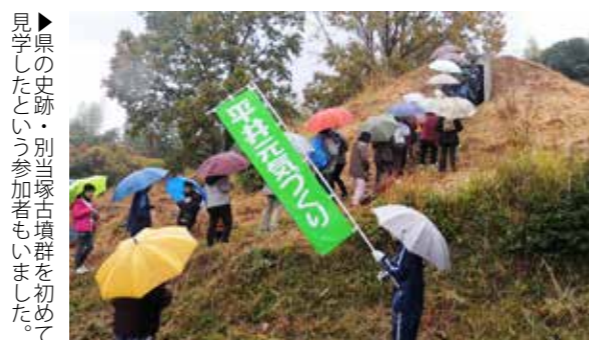
▶県の史跡・別当塚古墳群を初めて見学したという参加者もいました。

平井校区元気づくり委員会主催の平井地区史跡探訪ウォーキングは、平井小学校を発着に助丸・田倉・野中の史跡を巡るコースで開催されました。小雨が降る中、地域住民などおよそ70人が参加し、各史跡で区長や宮総代、西養寺住職から説明を受けました。