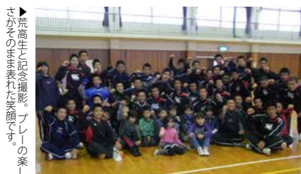
▶荒尾生と記念撮影。プレーの楽しさがそのまま表れた笑顔です。

12月8日～22日の毎週土曜日、3回にわたって第13回タグラグビー教室を行ったところ、市内各小学校から延べ60人が参加しました。