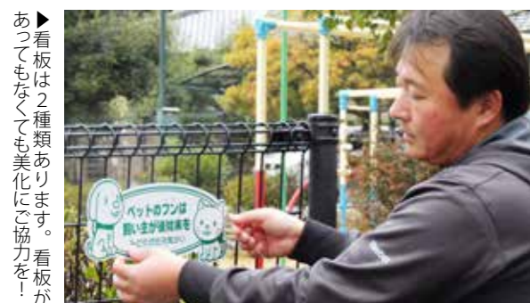
▶看板は2種類あります。看板があつてもなくても美化にご協力を！

みどりが丘元気かいでは、ペットのふん被害を防ぎ、地区を住みやすいまちにするマナーアップ運動に取り組んでいます。