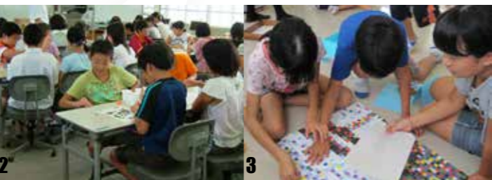
1_有明高校。丁寧に作業しました。2_緑ヶ丘小。みんなで力を合わせて作りしました。3_中央小。シートを合わせると絵柄が浮かびます。

あらおシティモール「出会いの広場」に展示している巨大モザイクアートの制作には、たくさんの市民の皆さんに協力していただきました。その制作風景の一部をご紹介します。