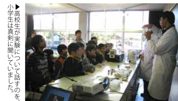
▶高校生が実験について話すのを、小学生は真剣に聞いていました。

「荒尾塾」で「わくわく！楽しい理科実験教室」を開催しました。「荒尾塾」は、荒尾高校の生徒が市内の小中学生に勉強などを教えるもので、地域一体となった小中学生の健全育成と学力向上を目指しています。