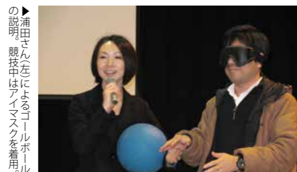
▶浦田さん(左)によるゴールボールの説明。競技中はアイマスクを着用。

荒尾市青少年育成市民会議は荒尾高校体育館で、ロンドンパラリンピックゴールボール金メダリストの浦田理恵さんを講師に、講演会を開催しました。浦田さんは20歳を過ぎて急激に視力が低下。「網膜色素変性症」と判明しました。左目の視力はなく、右目もほとんど見えませんが、周囲の支えと前向きな思考で競技に取り組み、見事金メダルを獲得しました。