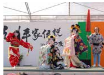
▲下関から上臈が来場します。

■日時 2月9日(土)～10日(日) ▶みやま市商工観光課 ☎ 0944-64-1523