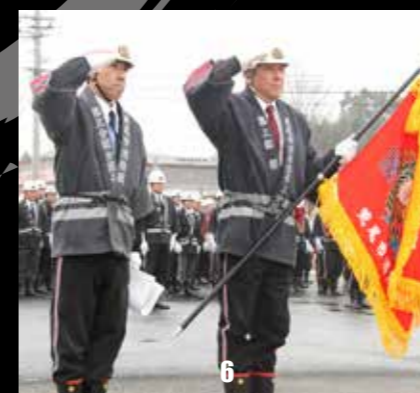
1 地域の安心安全を守る消防団員の、頼もしい背中。2 放水演習。冬空に力強い水の弧が描かれました。3 整然とした入場行進。消防団員の結束の強さが伺えます。4 整列にも緊張感が漂っています。5 機械器具点検。市内全域から全30台の消防車が集結し、圧巻でした。6 通常点検で優秀な成績を収めた第3分団(平井地区方面)。優勝旗を手に、引き締まった表情で敬礼。7 はしご車に搭乗する荒尾消防署員。このまま15mまで上昇。8 荒尾消防署員の通常点検。訓練を積んだ署員の動きは機敏で、観客からも称賛の声が上がりました。