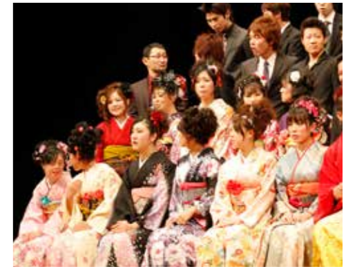
▲昨年の成人式での記念撮影。毎年、たくさんの新成人の皆さんにご参加いただいています。