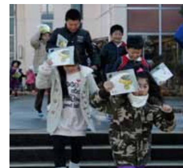
▲有明小学校で今年1月17日に行われた津波対応避難訓練。有明小学校では毎年行われています。繰り返しの訓練が、いざというときに役立ちます。