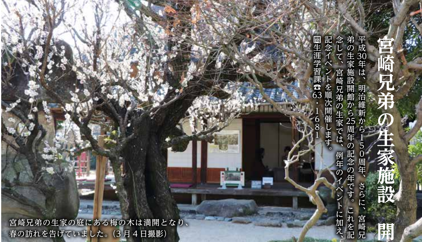
宮崎兄弟の生家の庭にある梅の木は満開となり、春の訪れを告げていました。(3月4日撮影)

平成30年は、明治維新から150周年、さらに、宮崎兄弟の生家施設開館から25周年の記念の年です。これを記念して、宮崎兄弟の生家では、例年のイベントに加え、記念イベントを順次開催します。 園生涯学習課 ☎63・1681