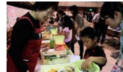
▲食生活改善推進コーナー(小ホール)