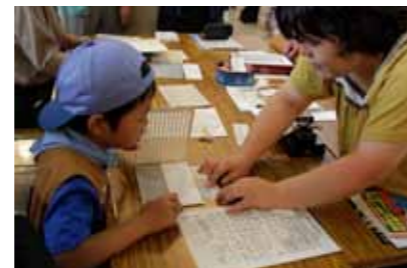
▲点字体験コーナー(ホワイエ)