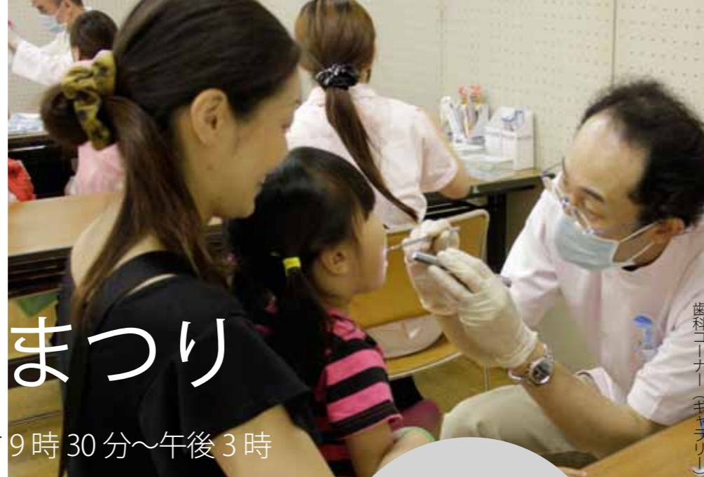
歯科コーナー(キッズ)