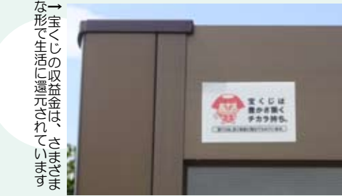
→宝くじの収益金は、さまざまな 形で生活に還元されています