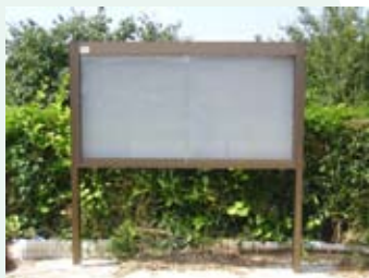
「このような掲示板がそれ ぞれ設置されました」

この掲示板の設置により、校区内のコミュニティ 活動が活性化されることが期待されます。