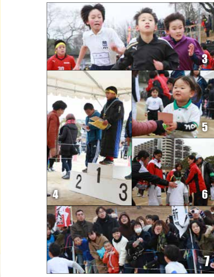
1・2・3 ゴールを目指して疾走 4 表彰式 5 参加賞を受け取る子ども 6 中学生もお手伝い 7 熱い声援を送る観客

1月28日、市民マラソン大会を運動公園陸上競技場一帯で開催しました。ことして46回を迎える大会には、子どもから大人まで1,600人ほどが参加。「毎年、楽しみに参加しています」と笑顔で話す小学生もいて、多くの皆さんに愛されて続いていた大会です。たとえ順位が上の方でも、走り終わった後の表情を見ると、晴れ晴れとした気持ちが伝わってきました。