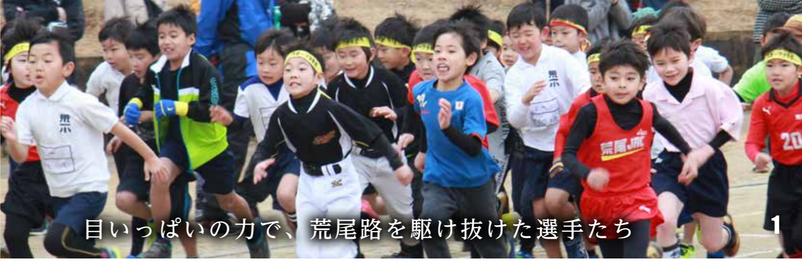
目いっぱいので、荒尾路を駆け抜けた選手たち

指定の駐車場をご利用ください 第1駐車場と第2駐車場がウォーク参加者用駐車場です。指定の駐車場以外への駐車はご遠慮ください。