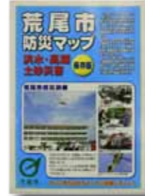
▲荒尾市防災マップ