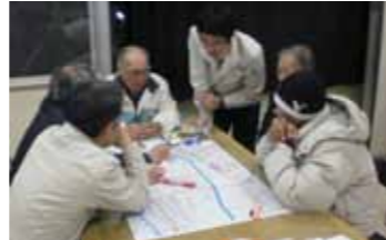
▲図上で地区の危険箇所や避難ルートを確認します。

話し合ったことはありますか。まずは防災マップを広げてみましょう。災害はいつ起こるか分かりません。分からないからこそ今、備えることが大切です。