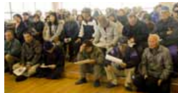
▲真剣な表情で講座を受講する有明地区の皆さん

荒尾市では防災に関する講座や相談を受け付けています。くらしいきいき課にご相談ください。