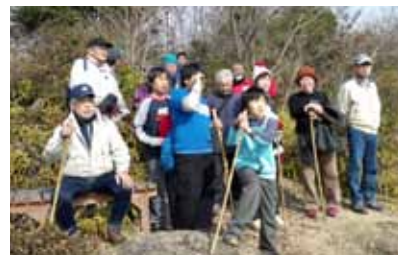
▲昨年の万田山ハイキング