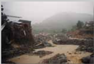
梅雨前線による豪雨で河川が氾濫した豪雨災害。美里町では道路寸断、土砂崩れで集落が孤立した。