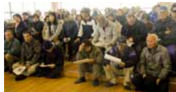
▲真剣な表情で講座を受講する有明地区の皆さん

荒尾市では防災に関する講座や相談を受け付けています。くらしいきいき課にご相談ください。