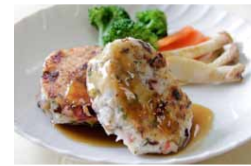
塩分控えめでもおいしい 里芋バーグ

◆材料(2人分)◆ サトイモ……………240g ゆでタコ……………60g 干しシイタケ……………2枚 青ジソ……………4枚 油……………小さじ1 だし汁……………大さじ1と1/3 しょうが汁……………適量 みりん……………小さじ2 しょうゆ……………小さじ1と1/3 片栗粉……………小さじ1/2 ◆栄養量(1人分)◆ エネルギー 153kcal たんぱく質 10.0g 脂質 2.5g 塩分 0.8g