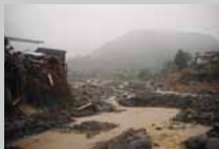
九州の広範囲を襲った集中豪雨。水俣市では大規模な土石流が民家を直撃。19人が犠牲になった。