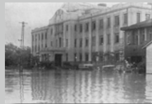
県北中部を中心に発生した集中豪雨。死者・行方不明者は500人超、家屋全壊は1,000戸を超えた大水害。