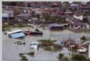
県内全土が大きな被害を受けた台風災害。宇城市(旧不知火町)では、高潮で12人が犠牲になった。