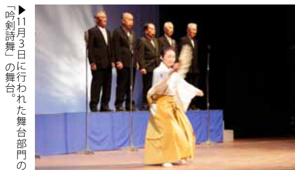
▶11月3日に行われた舞台部門の「吟剣詩舞」の舞台。

市民文化祭は、11月を中心に文化センターなどで開催されました。今年も文化芸術の秋にふさわしく、華道・吟剣詩舞・文芸・美術・合唱などの分野で活躍している人が、日頃の取り組みの成果を発表しました。