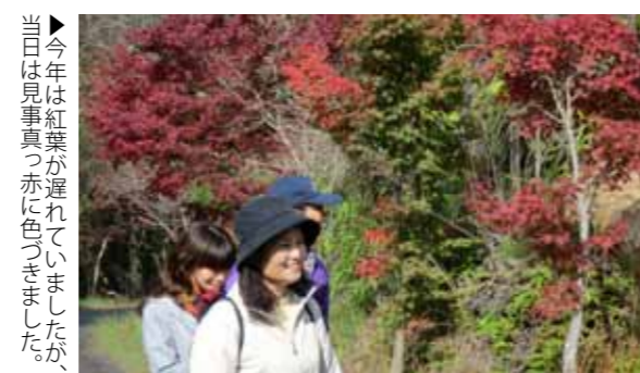
▶今年度は紅葉が遅れていましたが、当日は見事真赤に色づきました。

府本いきいき小岱会主催による「第7回紅葉狩りウォーク」が開催されました。ウォーキングをしながら、小岱山の色づき始めた紅葉と新鮮な空気を楽しむもので、府本登山口市営駐車場を出発し、不戦の森、観音寺を折り返す5kmのコースを歩きました。当日は小岱会名物の「ふかしイモ」が無料で振る舞われました。