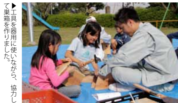
▶工具を器用に使いながら、協力して果箱を作りました。

万田炭鉱館とその周辺でエコパートナーあらおが、あらお環境フェスタ2011～豊かな環境を次世代に～が開催されました。