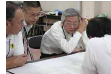
▲決まった条例案について、12月にパブリックコメントを募集する予定です。

そして、これまでの日本では当たり前だった「向こう三軒両隣」のような、近所で互いに助けあい、住みまちの課題を解決していくことができる関係を再び築いていきたいと考えています。