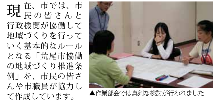
▲作業部会では真剣な検討が行われました

現在、市では、市民の皆さんと行政機関が協働して地域づくりを行って... 荒尾市協働の地域づくり推進条例」を、市民の皆さんや市職員が協力して作成しています。