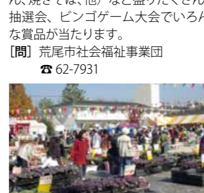
▲昨年の感謝祭も盛況でした。