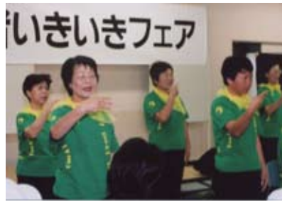
「手話ダンスサークルひびき」

「音楽会」…市内に在住もしくは、市内の施設に通われている身体障害者手帳をお持ちの人による、歌・楽器演奏・踊りの発表。