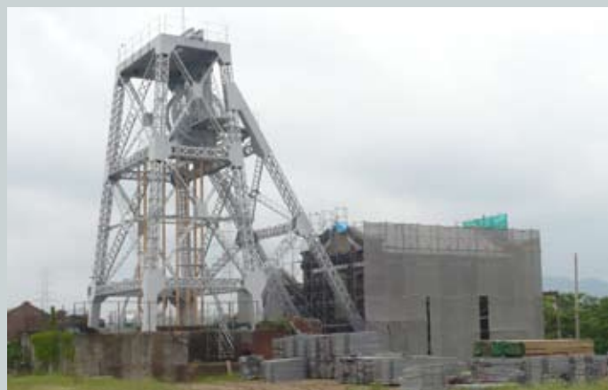
↑ 銀白色に塗装された万田坑の第二豎坑櫓と、現在工事中の巻揚機室