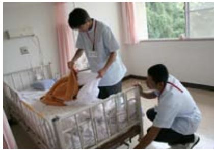
しわなく早くシーツを換えるには、コツが必要。だんだん手際がよくなっていました。

足浴を受けた人は「楽しみに待っていました。孫からしてもらったようだ」と嬉しそうに話していました。高校生は体験を終え、「難しいけれど喜ばれるとうれしい」と笑顔を見せました。