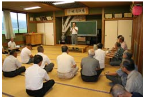
熱心な意見交換が行われました。

7月23日（木）、上井手上地区集落農事集会所で「まちづくり談義」が行われました。市長が地域の皆さんと直接語り合い、市政への意見や提言をいただきました。この日は、学校校舎の耐震化について、元気会の活動についてなどの意見が交わされました。