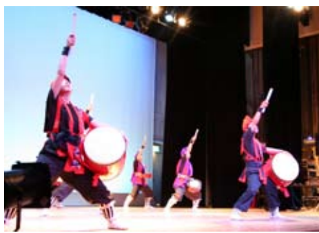
↑披露されたエイサー。躍動感あふれる踊りでした。

力強く見ごたえのあるステージに、訪れたおよそ450人の観客は大きな拍手と声援を贈っていました。