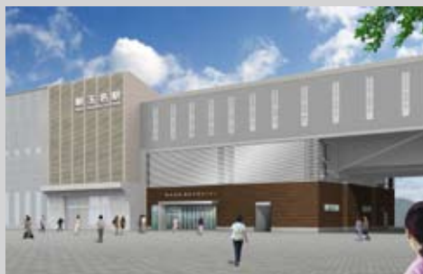
新玉名駅と観光交流施設の完成イメージ図