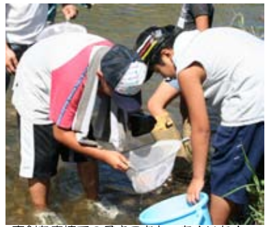
真剣な表情でのぞきこむと…あ！いた！

8月7日（金）、岩本橋付近の関川で「生物教室」が開催され、荒尾市、大牟田市、南関町の児童26人、保護者17人が参加しました。