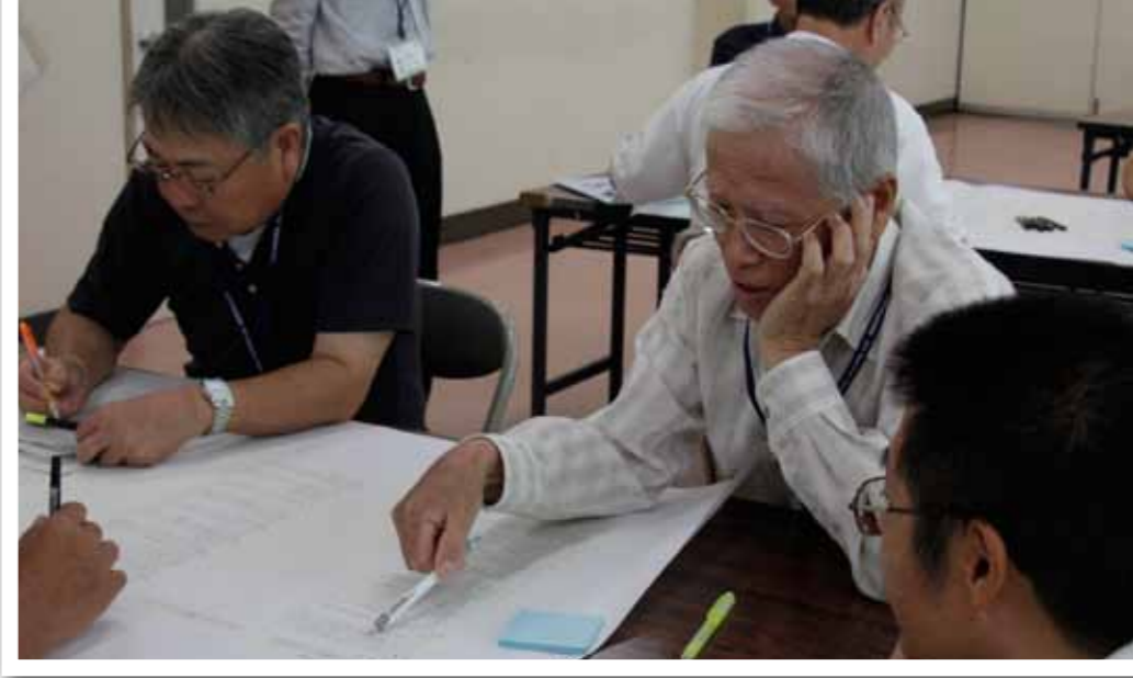
▶条例作業部会による条例案検討ワークショップ。条例の素案に対して疑問に感じることや率直な意見を出し合い、よりよいものを作り上げていきます。