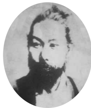
みやざきとうてん 宮崎滔天 (1871-1922)