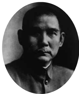
そんぶん 孫文 (1866-1925)

香港西医書院（現香港大学医学部）を卒業 最初の蜂起「広州起義」に失敗、日本へ 9月横浜で終生の友となる宮崎滔天と出会う