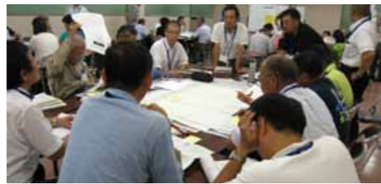
▼今後のまちづくりについて、皆で意見を出し合いました

総合計画審議会は、市民、学識経験者、市議会議員計 29 人で構成され、今後の 10 年間のまちづくりの方向性を示す基本構想と、具体的な施策をまとめた 5 年間の基本計画を市長からの諮問に基づき、審議を行い、答申します。