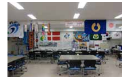
▲東松島市震災復興本部は、全国から寄せられた励ましの声に満ちています。ここを拠点に、東松島市は復旧・復興に向けて全力で取り組んでいます。

被災地の状況は刻一刻と変わっていくため、状況に合わせたさまざまな形の支援を考える必要があります。市からも職員の派遣を続けていきますが、私たち一人一人が東北を見守り、つながり、今できる必要な支援を続けていきたいものです。