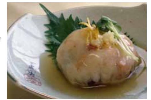
レンコンとあんの上品な蒸し物 れんこんまんじゅうのあんかけ