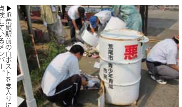
▶JR荒尾駅前の白ポストを念入りに点検しているメンバー。

荒尾市青少年育成市民会議は、社会を明るくする運動の一環として、環境浄化・白ポスト点検を実施、有害図書やDVDを回収しました。