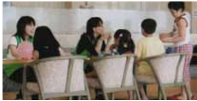
▲被災地での市職員と子どもとの交流