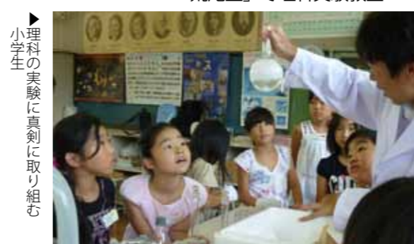
▶理科の実験に真剣に取り組み小学生

「荒尾塾」は、市内の高校生と地域の皆さんが一体となった取り組みで教育環境を整備し、小中学生の学力などの向上を目指しています。