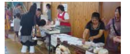
▲昨年の桜山ふれあいげんき祭り