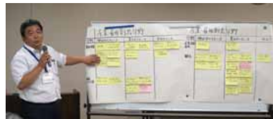
▲グループ長による検討内容の中間報告

総合計画審議会の審議検討内容などについては、市のホームページにも適宜掲載しますので、ご覧ください。