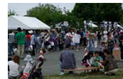
▲東松島市役所横で7月23日(土)に行われたお祭りは、にぎわいを見せていました。訪れた被災者の皆さんに、食事などがふるまわれ、長蛇の列ができていました。