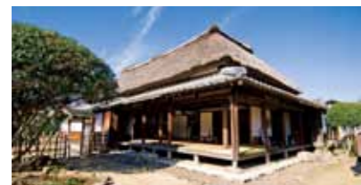
▲宮崎兄弟の生家施設