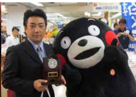
くまもと記念撮影