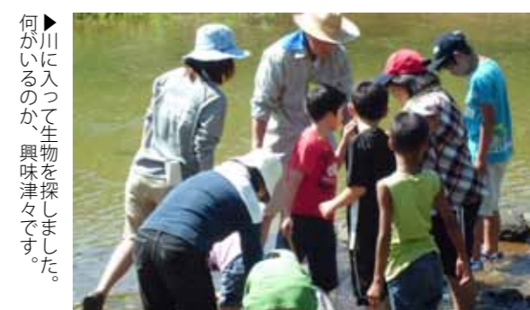
▶川に入って生物を探しました。何がいるのか、興味津々です。

岩本橋付近の関川で「生物教室」が開催され、荒尾市、南関町、大牟田市の児童36人が参加しました。