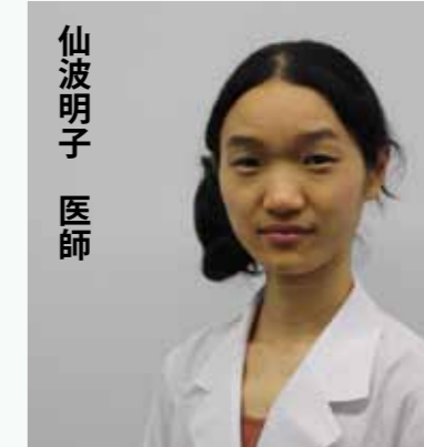
放射線治療科医師 卒業年次 平成20年度 資格・認定 マンモグラフィ読影認定医