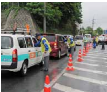
▲毎月22日に開催されている、飲酒運転撲滅キャンペーン。8月22日（月）は飲食店組合と共同開催されます。

車両提供者・酒類の提供者・車両の同乗者も、 運転免許の行政処分（取消・停止）を受けます。