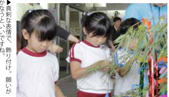
▶真剣な表情で、飾り付け。願いがかなうといいですね

市役所の玄関で万田保育園の園児が、笹に七夕の飾り付けをしました。笹は毎年、熊本県建設業協会荒尾支部のご好意で用意されています。 園児たちは手作りのお飾りや、願いを込めた短冊を結びつけていました。飛び入り参加で、建設業協会の皆さんも園児たちと一緒に飾り付けをしていました。また、飾り付けの後には、元気いっぱいに「七夕の歌」を披露しました。 市役所の玄関は夏の風物詩で飾られ、来庁者も足を止めて眺めていました。