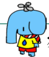
▲水道局イメージキャラクター あらぞうくん