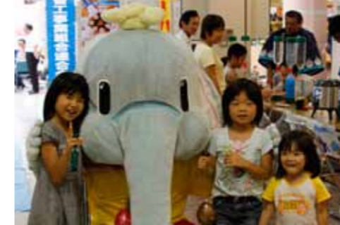
▲昨年の上・下水道展。あらぞうくんも参加します。親子で楽しむことができる催しとなっています。

私たちは自然のなかで循環している水を利用しています。上水道はきれいなおいしい水を家庭に送り、下水道は家庭や工場で汚れた水をきれいにし海に返しています。