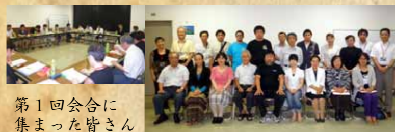
第1回会合に 集まった皆さん