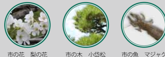
市の花 梨の花 市の木 小袋松 市の魚 マジャク