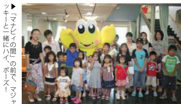
▶「マナビィの間」の前で、マジックキーと一緒にハイポーズ！

市中央公民館ロビーで、「マナビィの間」のオープニングセレモニーが行われました。「マナビィの間」は、畳敷きのスペースに、ソファ、円卓、本棚が置かれた交流の場です。 幼稚園児などによるテープカットやおはなし会、竹とんぼ作り、あらおクラシックギター同好会コンサートが開催された後、館職員手作りの紅白餅が来館者に振る舞われました。 また、市のマスコットキャラクター「マジックキー」との記念写真撮影会も行われました。