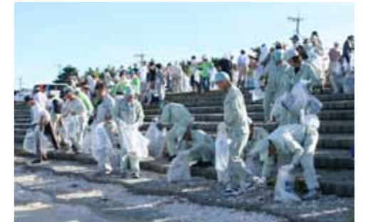
▲昨年は蔵満海岸が熊本県のメイン会場でした。今年もたくさんの方の参加をお待ちしています。