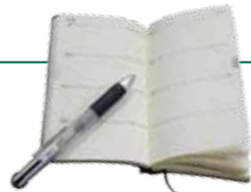
※ペンはついていません

▽資料・名簿編 荒尾市行政機構図、市議会議員名簿、納税ごよみ、市民課窓口事務のご案内、官公署等連絡先一覧表、市町村別人口・面積など。