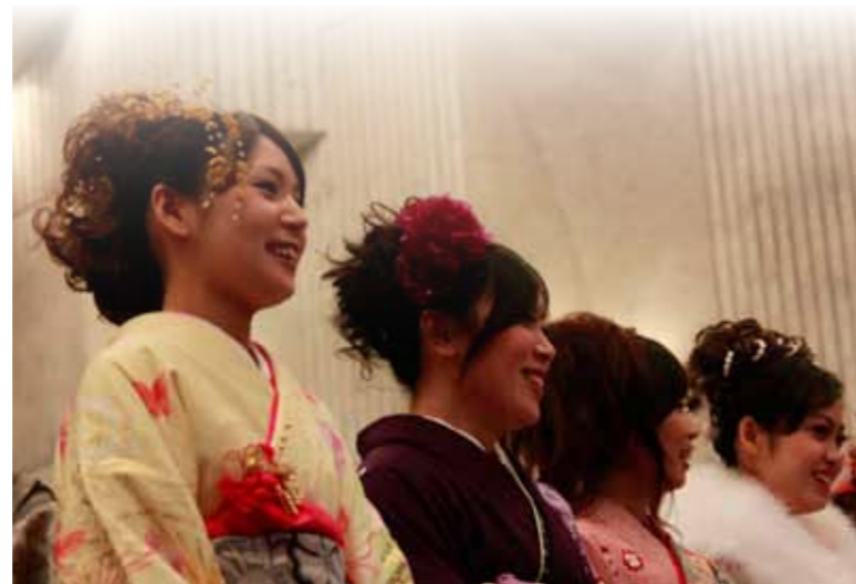
▲本年の成人式。多くの新成人の皆さんをお祝いすることができました。来年もたくさんの方の参加をお待ちしています。お問い合わせのうえ、ご参加ください。

●内容 アトラクション、式典、記念行事、記念写真撮影 社会教育課 ☎ 63-1681