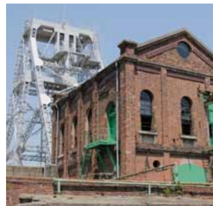
▲荒尾の宝 万田坑施設