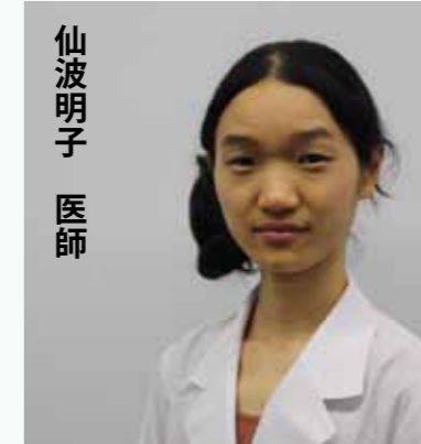
放射線治療科医師 卒業年次 平成20年度 資格・認定 マンモグラフィ読影認定医