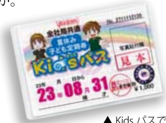
▲ Kids パスで夏の思い出づくり

県内ほとんどの地域で使用することができますので、夏休みの思い出作りのために、いろんなところを旅してみませんか。