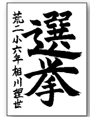
平成22年度 習字の部 入選作品 (旧荒尾二小)

●応募方法 作品は、応募先まで郵送または持参してください。 【ポスター】 ・テーマ 「明るい選挙」 ・対象者 小・中・高校生 ・用紙・画材 紙は画用紙の四つ切か八つ切、それに準じる大きさ、画材は自由(絵具材料に限らない) ・その他 裏面に住所、氏名、学校名と学年を記入してください 【習字】 ・対象者とテーマ 小3「未来」、小4「政治」、小5「投票」、小6「選挙」、中1「義務」、中2「国民権」、中3「地方自治」 ・用紙など 和半紙(33cm×24cm) ・その他 和半紙左に学校名、学年、氏名を記入してください 【標語・4コマ漫画】 ・テーマ 有権者に選挙の大切さを伝えるもの、または明るい選挙を呼びかけるもの ・対象者 どなたでも ・応募用紙 県選管のホームページからダウンロードしてください ●締切 9月9日(金) [問・応募先] 〒864-8686(住所不要) 荒尾市選挙管理委員会 ☎ 63-1254