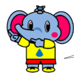
企業局マスコットキャラクター「あらぞうくん」

外の気温が氷点下4℃以下になると水道が凍結しやすくなります。特に屋外、北側で日が当たらない場所、風当たりが強いところ、むき出しになっている水道管は注意が必要です。