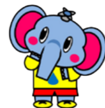
企業局マスコットキャラクター「あらぞうくん」

宅地内の配管で漏水が止まらないときは、水道メーターボックス内にある止水栓を回して止水してください。また、止水栓を年2回程度動かして作動状況の確認をお願いします。