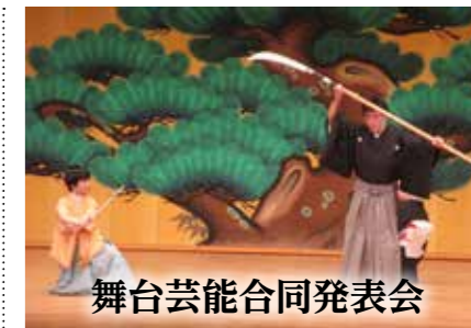
舞台芸能合同発表会