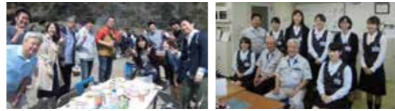
▲当社の社員たち。みんな仲良しです