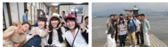
▲昨年は台湾、ことしは広島へ社員旅行に行きました