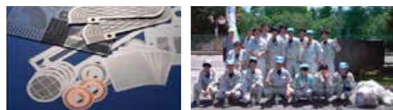
▲お客様のニーズに応え、高品質な製品を短納期で作り上げています ▲荒尾市をきれいにを目標に清掃活動をしています