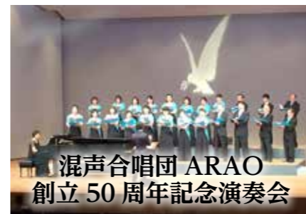
混声合唱団 ARAO 創立50周年記念演奏会