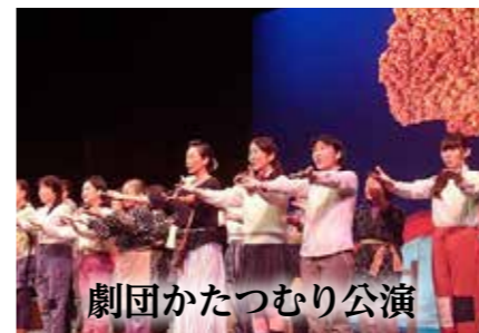
劇団かたつむり公演

ことしも秋の祭典を開催します。見どころ満載のイベントを多数用意して皆様のご来場をお待ちしています！ 市民文化祭開会式を5日(日)午前10時から大ホールで行います。