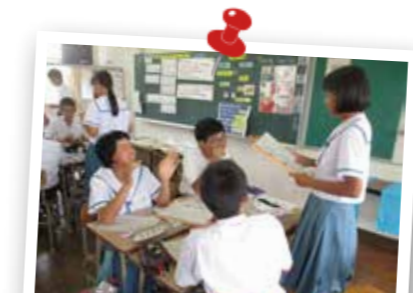
英語科の授業では、生徒同士が英語を使つてのコミュニケーションに取り組んでいます。「英語で話すと楽しいな(〇〇)」