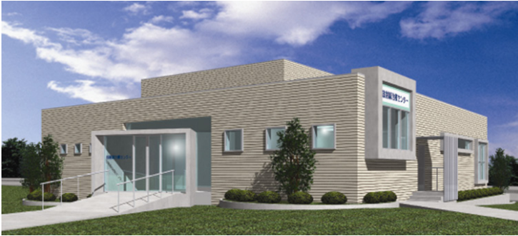
▲荒尾市民病院放射線治療センター完成予想図