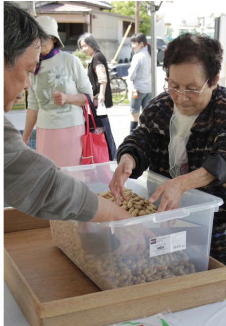
【写真】 1_ 毎回大好評のピーナッツのつかみどり。お店の人も大盤振る舞いです。 2_ 地元の元気づくり 二小元気会による金魚すくい。子どもたちも楽しめるイベントです。 3_ 無料のさげもん教室も開催。たくさんの方が参加していました。