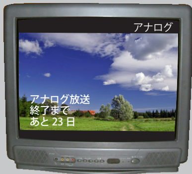
▲7月1日（金）～24日（日）正午までのアナログテレビの画面。カウントダウンが始まります。

総 務省では、住民税非課税世帯やNHK受信料全額免除の無償給付を行っています。 ■総務省地デジチューナー支援実施センター （非課税世帯支援世帯の人） ☎0570・023724 （NHK受信料全額免除世帯の人） ☎0570・033840 （平日：午前9時～午後9時、土・日・祝日：午前9時～午後6時）