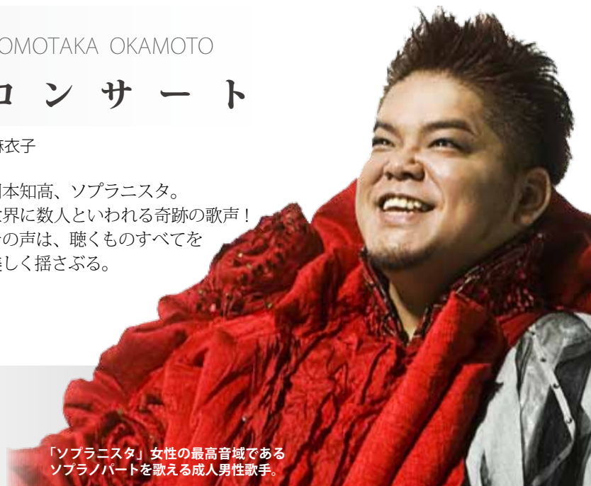
「ソプラニスタ」女性の最高音域であるソプラノパートを歌える成人男性歌手。