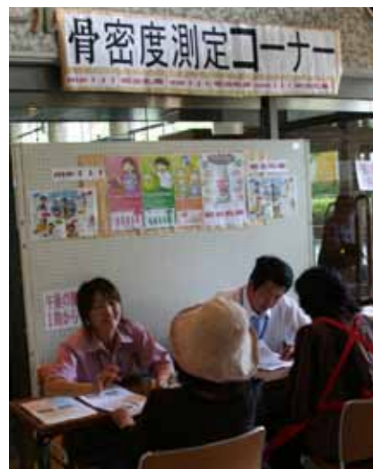
▲昨年の骨密度測定コーナー