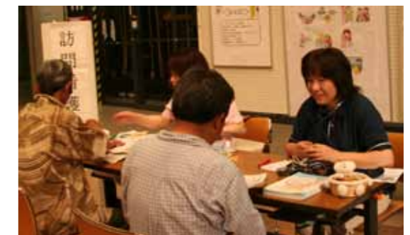
▲昨年の訪問介護相談