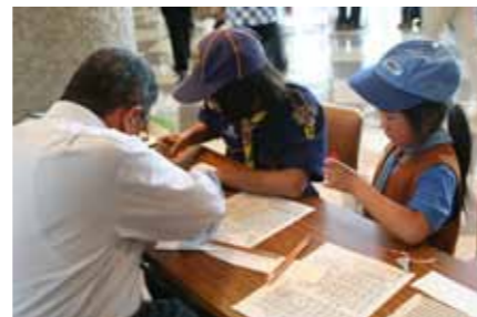
▲昨年の点字体験コーナー