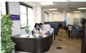
患者図書室ボランティアの皆さん、いつもありがとうございます