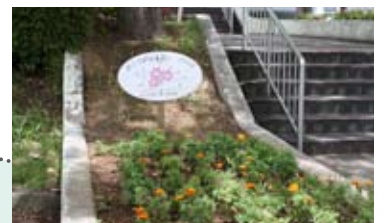
玄関前のマリーゴールド

「市民を愛する市民に愛される病院」を目指し、患者さんが安心して来院できるよう支援していただく病院ボランティアを募集します。病院ボランティアとは、来院する人々に安らぎを与え、相手の立場に立ち、やさしく温かな対応をしてくださる人のことをいいます。