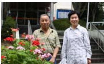
弥山サークルさん、花壇の手入れいつもありがとうございます

●日時 8月28日（金）午後3時～4時 ●場所 第一会議室 【問】市民病院総務課庶務企画係 ☎ 63-1115（内線511）