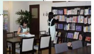
皆様に役立つ本を大切に管理しています