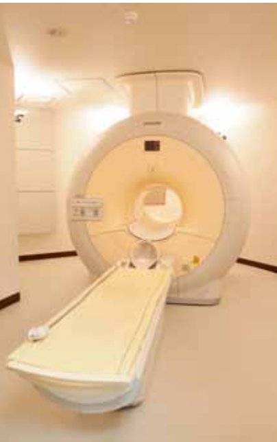
▲体内などの断面画像を撮影することができる装置「MRI」

てんかんは、高齢者に多くみられることから、最近当院でも増加傾向にあります。一方、小児や