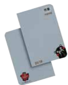
▲荒尾市の情報がたくさん載ってるモノ みんな買ってね!

県や市町村の最新統計資料などを掲載しているコンパクトで使いやすい市民手帳の予約を受け付けます。 ●主な内容(2部構成) 【日記編】月間予定表、見開き1週間タイプ日記欄 【資料・名簿編】市民課窓口事務・保健予防事業のご案内、市避難所一覧など ●サイズ 縦15cm×横9.4cm ●価格 470円(税込) ●発売予定日 11月中旬 ●予約方法 電話か市ホームページから予約 圃政策企画課企画統計係 ☎63・1274